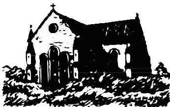
Abbaye de Saint Jean aux Bois